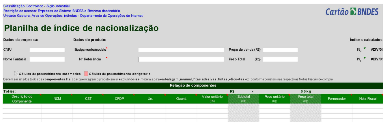
Figura 1 - Planilha utilizada para cálculo do índice de nacionalização dos produtos

A figura 1 mostra a planilha usada no cálculo do índice de nacionalização dos produtos.